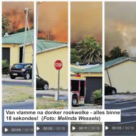
Van vlamme na donker rookwolke - alles binne 18 sekondes!

Gemeenskapslede het ook by BARC (Birkenhead Animal Rescue Centre) bymekaar om honde en katte op te laai indien nodig. Dit is 'n riem onder die hart om te luister na die wonderlike optredes van gemeenskapslede en besighede - dit is Gansbaai, waar nood mense laat saamstaan. Die Gans-Berg Nuus bedank graag 'n ieder en 'n elk vir hulle kosbare bydraes.