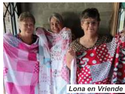
Lona en Vriende