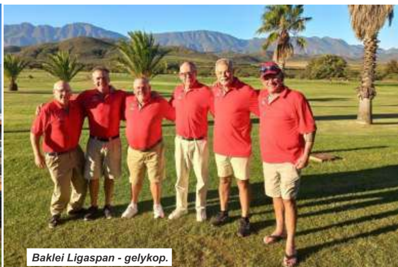
Baklei Ligaspan - gelykop.