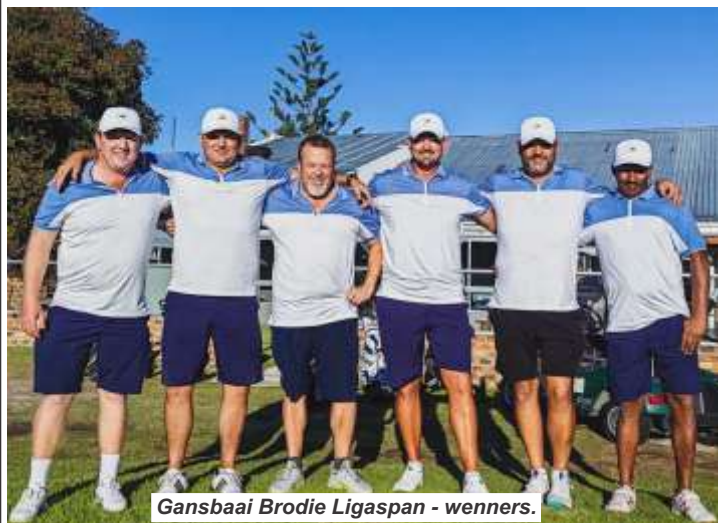
Gansbaai Brodie Ligaspan - wenners.