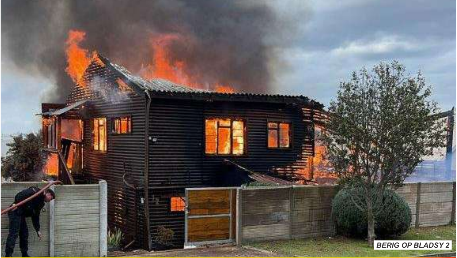
BERIG OP BLADSY 2