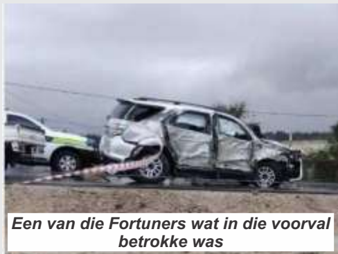
Een van die Fortuners wat in die voorval betrokke was

'n Grusame motorongeluk op die R43 naby Stanford op 1 Mei 2025 om 11:48, het die lewens van drie kinders geëis - 'n 7-jarige seun, 'n 8-jarige dogter en nog 'n 10-jarige dogter wat opslag dood is. "Dit was 'n grusame toneel om te aanskou," het AdjOff Booyen van Stanford SAPD gesê. Die ongeluk, asook foto's, is reeds wyd en syd op sosiale media versprei, maar Gans-Berg Nuus het met AdjOff Booyen gesels om seker te maak die feite is korrek.