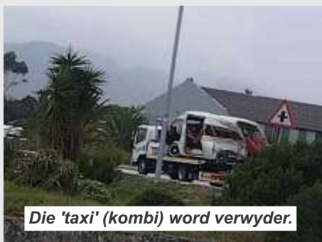
Die 'taxi' (kombi) word verwyder.

"Van die ander kinders is ernstig beseer, met een vrou wat uit die