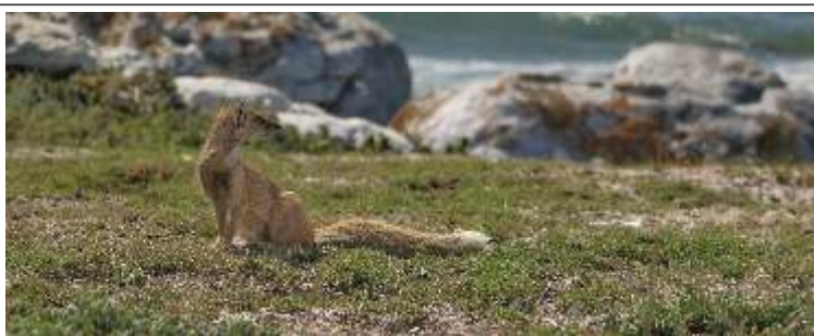
This is a yellow mongoose that was spotted in the Walker Bay Nature Reserve - look at the slinky lines.

Hardus: 082 786 0494 Email: info2@gansberg.co.za