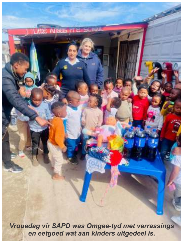
Vrouedag vir SAPD was Omgee-tyd met verrassings en eetgoed wat aan kinders uitgedeel is.