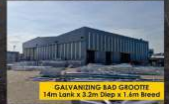
GALVANISERING BAD GROOTTE 14m Lank x 3.2m Diep x 1.6m Breed

Diens beskikbaar in Gansbaai en omliggende dorpe - Skakel vandag nog of besoek galvatech.co.za