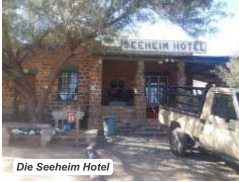
Die Seeheim Hotel