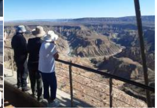
Die verruklike uitsig oor die Visrivier Canyon.