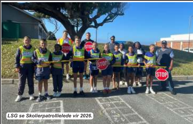
LSG se Skolierpatroliëde vir 2026.