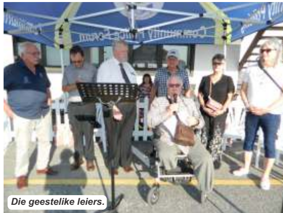
Die geestelike leiers.