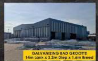
GALVANIZING BAD GROOTTE 14m Lank x 3.2m Diep x 1.6m Breed

Diens beskikbaar in Gansbaai en omliggende dorpe - Skakel vandag nog of besoek galvatech.co.za