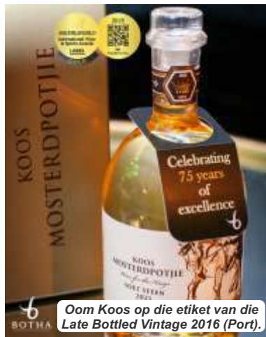
Oom Koos op die etiket van die Late Bottled Vintage 2016 (Port).