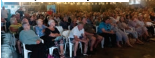
Die Pearly Beach Hengelklubsaal was volgepak met bekommerde belangstellers oor die kernkrag-kwessie.