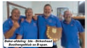
Beker-afdeling: 2de - Birkenhead Boothengelklub se B-span.