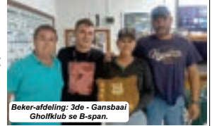
Beker-afdeling: 3de - Gansbaai Gholffklub se B-span.