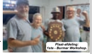
Plaat-afdeling: 1ste - Burmar Workshop.