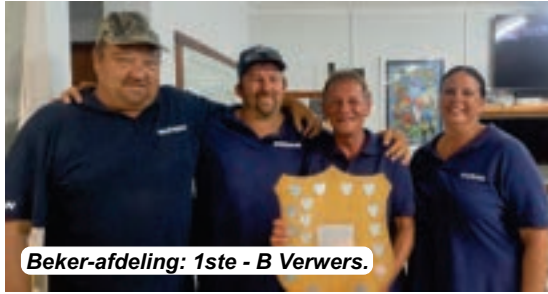
Beker-afdeling: 1ste - B Verwers.

In die Beker-afdeling het B Verwers eerste geëindig, met die Birkenhead Boothengelklub se