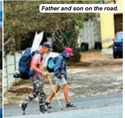
Father and son on the road.