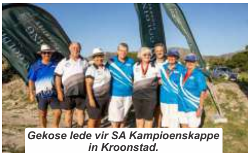
Gekose lede vir SA Kampioenskappe in Kroonstad.