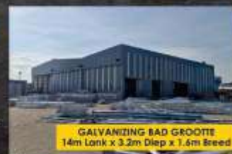
GALVANIZING BAD GROOTTE 14m Lank x 3.2m Diep x 1.6m Breed

Diens beskikbaar in Gansbaai en omliggende dorpe - Skakel vandag nog of besoek galvatech.co.za