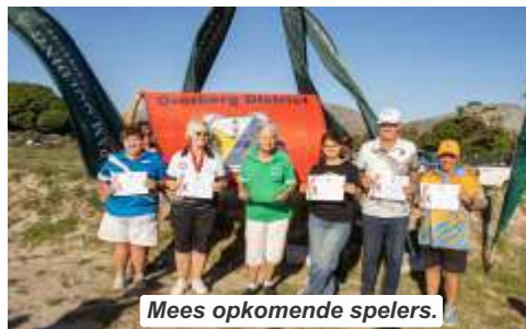
Mees opkomende spelers.