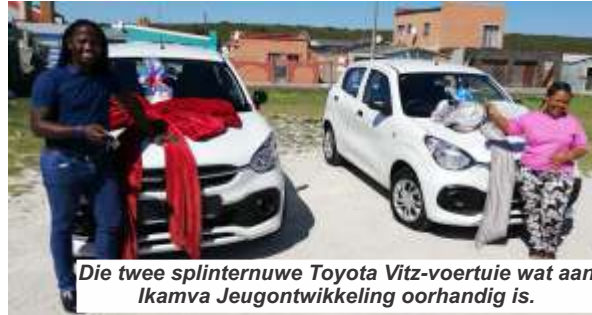
Die twee splinternuwe Toyota Vitz-voertuie wat aan Ikamva Jeugontwikkeling oorhandig is.

Sy sê dit bring mee dat dit nie meer vir mense nodig sal wees om vir hulp na 'n rehabilitasiesentrum te gaan nie, wat baie duur kan wees. Met behulp van die voertuie kan rehabilitasie nou binne die gemeenskap aangebied word. Jolande sê die maatskaplike werkers het al die jare van hul eie vervoer gebruik gemaak.