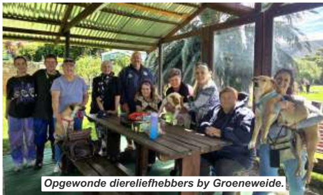
Opgewonde diere liefhebbers by Groeneweide.