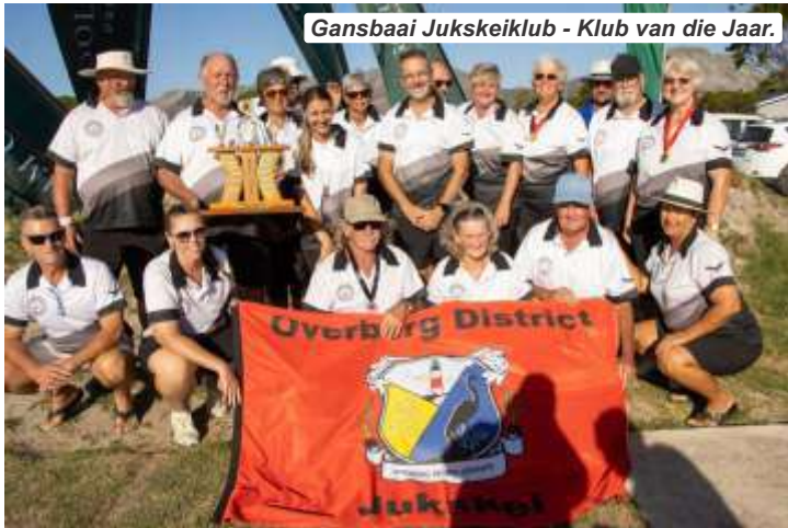
Gansbaai Jukskeiklub - Klub van die Jaar.