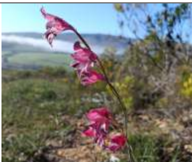
This scarlet beauty is Gladiolus guthriei at Grootbos Foundation. These beautiful bulbs burst into flower with the winter rains. If invasive plants are not cleared from the natural landscape, they can outcompete and overcrowd indigenous beauties like this one.