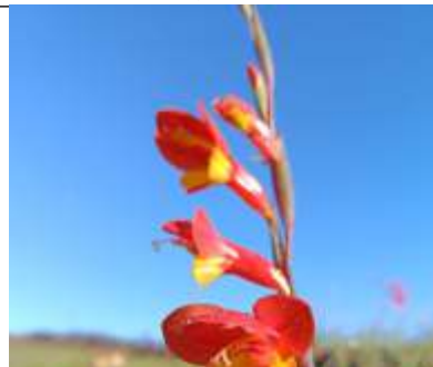
This is the Gladiolus overbergensis , which caught the eye in the field at Grootbos Foundation, just as it catches the eye of bird and insect pollinators.