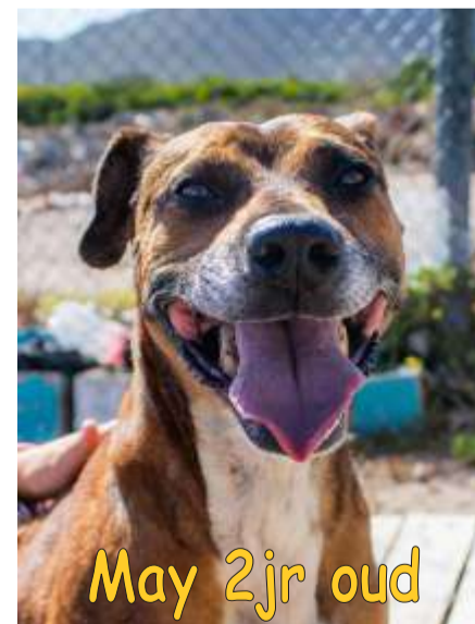
May 2jr oud