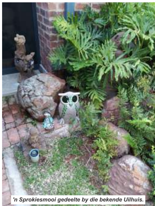
'n Sprokiesmooi gedeelte by die bekende Uilhuis.