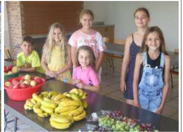
Dis mos nou 'n Vrugtefees!