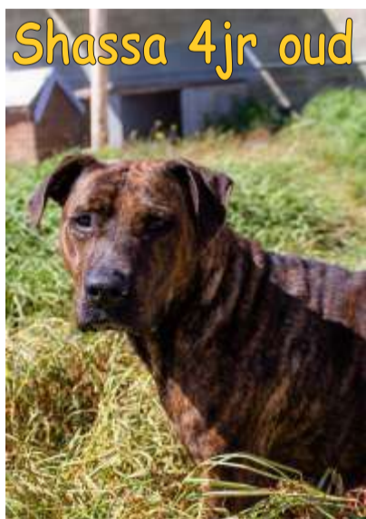
Shassa 4jr oud