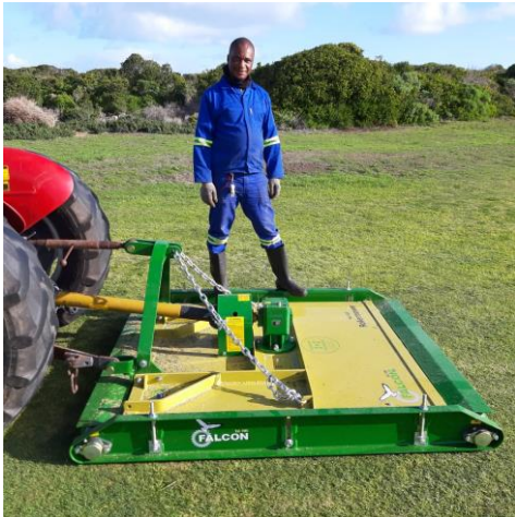
Welcome met nuwe Falcon grassnyer, gekoop met LOTTO-geld

Ons koop 'n splinternuwe grassnyer om die skoonvelde mee te sny ... die 1ste keer in 22 jaar wat ons die voorreg het om iets nuut te koop, te danke aan LOTTO! [sien vlg. 2 foto's]