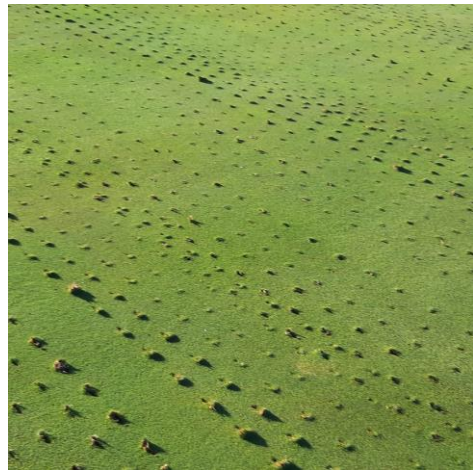
Setperke kry “spike rolling”

Eindelik breek die dag aan en op die 13de Junie word ons weer toegelaat om gholf te speel [ sien vlg. 2 foto’s ] met alle lange reëls en regulasies wat toegepas moes word en pakke papierwerk wat voltooi moes word.