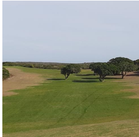
Netjies gesnyde skoonveld van Knersus, putjies 5 en 14

Dit is ook die 1ste keer in die klub se geskiedenis dat die skoonvelde besproei was gedurende die warm somer maande. Ons het 'n lid gehad wat geld geborg het vir die kunsmis en dit is die rede waarom die skoonvelde so mooi groen kon bly in die warm maande. Die setperke is in 'n baie goeie toestand, met minimale onderhoud.