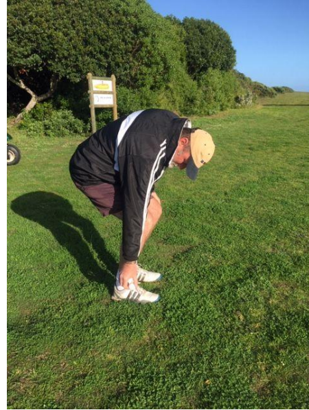
Nie toegelaat: Gebuigde knie Not allowed: Bent knee