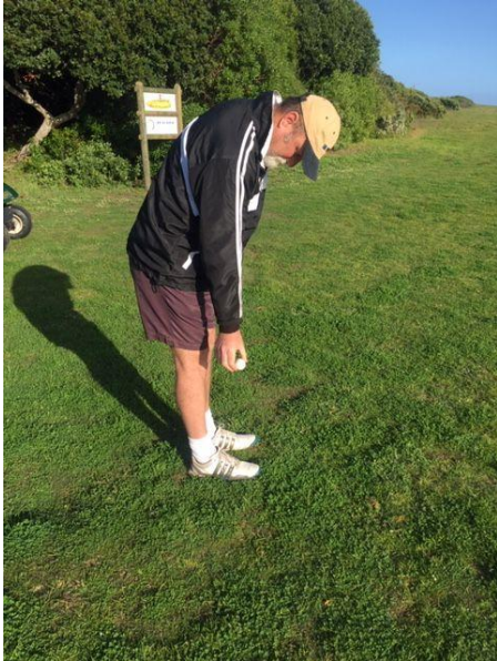
Toegelaat: Reguit been kniehoogte Allowed: Straight leg knee height

If it doesn't, you will need to drop once more before being allowed to place it.